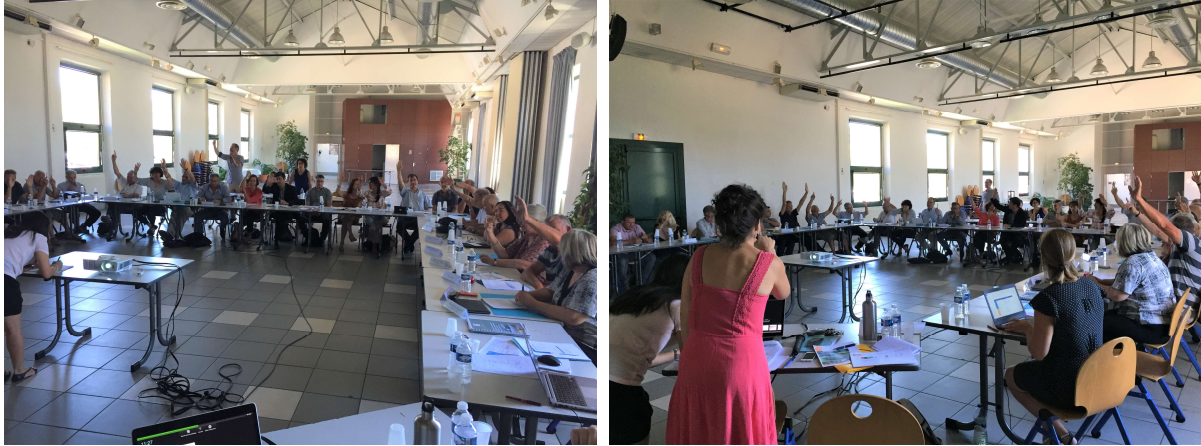
Source SMBVG : réunion de la CLE du 6 juillet 2017 pour le vote de la stratégie