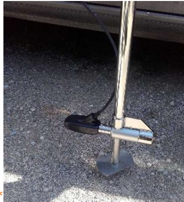
Figure 1: Réalisation d'une mesure de débit au courantomètre (à gauche) - Sonde du courantomètre (à droite)